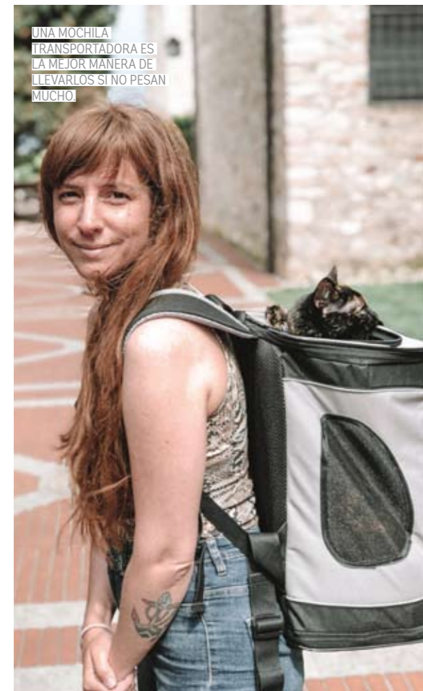
UNA MOCHILA TRANSPORTADORA ES LA MEJOR MANERA DE LLEVARLOS SI NO PESAN MUCHO.

¿Voy a conseguir un hotel pet-friendly ? ¿Y si voy a un lugar y no me dejan entrar? ¿Se quedará un rato sola si la dejo? ¿No le hace mal viajar en la bodega de un avión? A veces son tantas las dudas y miedos que ni siquiera nos animamos a plantearlas. Pero la clave está en informarse mucho antes de viajar, no solo acerca del destino, sino también acerca del comportamiento y la personalidad de nuestras mascotas. En lo posible, lo ideal es contactar con un especialista en comportamiento para enseñarles a quedarse solas, adaptarse a lugares nuevos, habituarse a su transportadora, porque son cosas que se pueden trabajar de forma positiva. Porque, sobre todo si el viaje es parte de las vacaciones, hay que buscar que sea placentero para todos. Otra clave es informarse de antemano sobre el destino y su grado de amabilidad hacia los animales. Por ejemplo, si vos querés viajar con tu mascota a Florencia, en Italia, y visitar miles de museos, es probable que no sea el mejor plan. Pero visitar una ciudad con playa puede ser una excelente elección, en cambio.